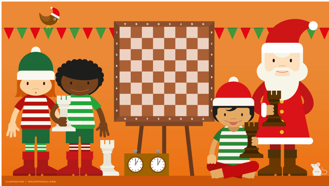
Illustration: Friederike Hofmann

Wir wollen von Euch wissen: Wo steht denn nun der blaue Turm?